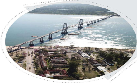
Puente General Belgrano, une las provincias de Corrientes y Chaco